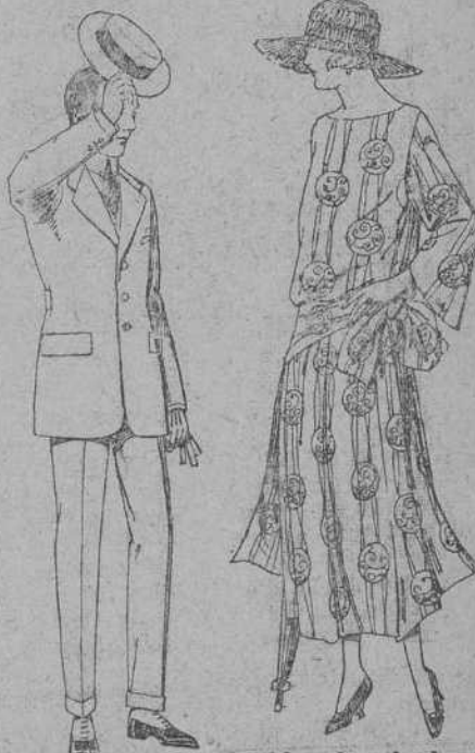
Vestidos de voile de al- godón estampado, dife- rentes dibujos. De ptas. 55 a 70. Trajes modelo Sport, lana, melton, etc. De ptas. 52 a 125.

PRECIO FIJO PÍDASE EL CATALOGO GENERAL VENTAS AL CONTADO