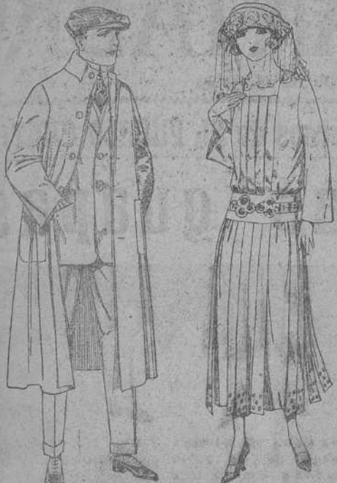
Guardapolvos de drill, Vestidos de popeline, igual al modelo. De ptas. 10 a 20. azul y color, adornos bordados. De ptas. 95 a 110.

Sucursales: Madrid, Barcelona, Alicante, Almería, Bilbao, Cádiz, Cartagena, Gijón, Granada, Málaga, Palma de Mallorca, Santander, Sevilla, Valencia, Valladolid, Zaragoza