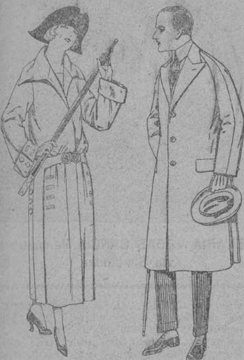
Abrigos de g. bardina ir- Gabanes de melton, gies, impermeabilizade, gabardina, etc. en negro, azul y color. De ptas. 60 a 180. De ptas. 85 a 200.