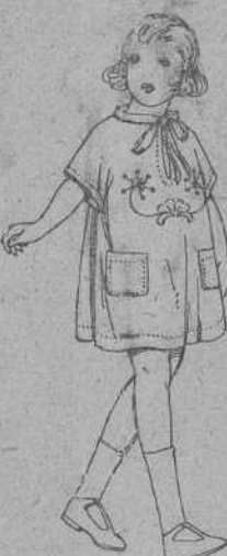
Delantales de voile, colores moda, adornos bordados, para niñas de 3 a 6 años. De ptas. 12 a 18.