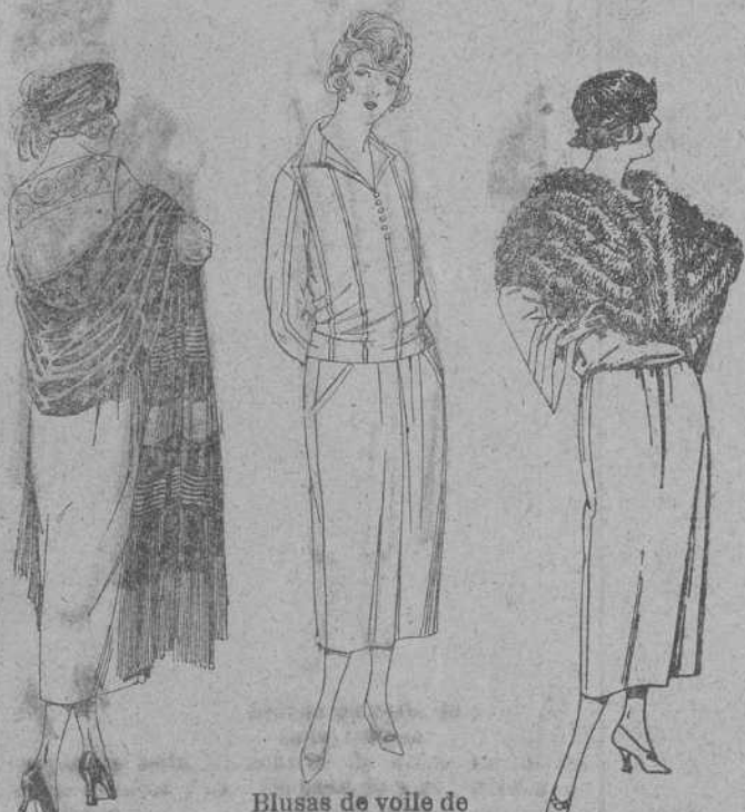
Blusas de voile de seda, listada, colores de moda. De ptas. 23 a 27. diferentes modelos, en diferentes dibujos y calidades. De ptas. 20 a 200. Faldas de popeline, negro, estambre, etc., en negro, azul y color. De ptas. 30 a 45. Capelinas de marabú, diferentes modelos, en negro, blanco y marrón. De ptas. 30 a 75.

Ropas confeccionadas para Caballero, Señora, Niño y Niña.