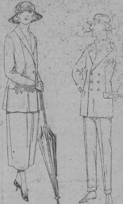
Trajes sastre, de sar- Trajes de lavilla, mel- ga inglesa, popeline, ton, estambre, vicuña, etc., adornos borda- jerga, etc. dos, chaqueta forra- De ptas. 40 a 150. ca de seda, en mari- no, negro y colores moda. De ptas. 125 a 160.

Boas, Camisería, Géneros de punto, Corbatería, Guantería, Sombrerería, Zapatería, Paraguas, Bastones, Sombrillas y Artículos de viaje.