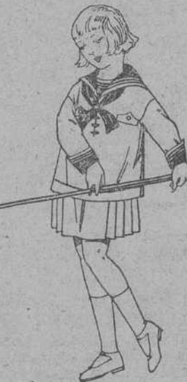
Trajes modelo «Marinera Inglesa», de drill, otomán o satén blanco, para niñas de 4 a 9 años. De ptas. 20 a 35.