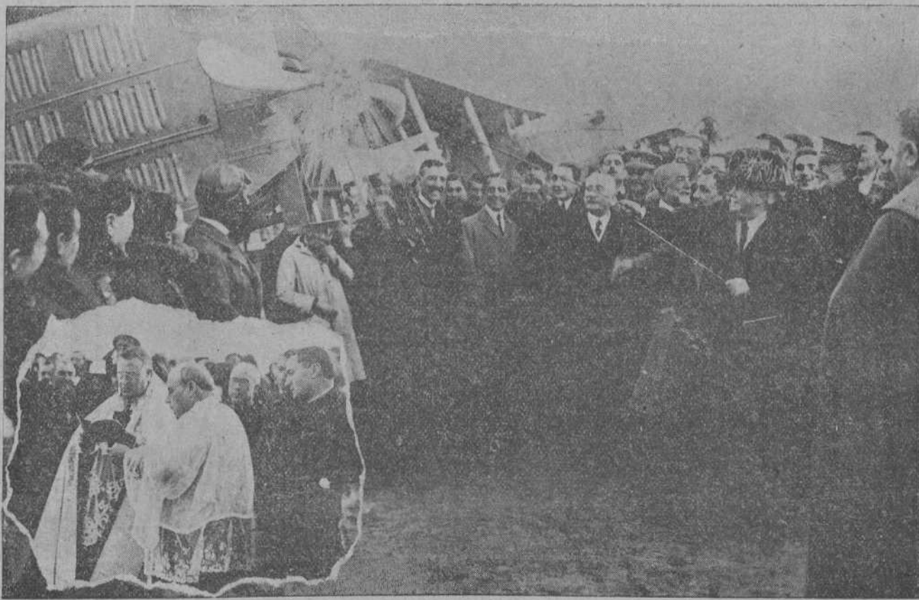
EN MADRID.—Bendición del aeroplano «Pedro Velarde». Momento de ser rota por la infanta doña Isabel, que representaba a Su Majestad la Reina, la botella de champán.—En el ángulo, el obispo de Santander, en el momento de la bendición del aeroplano.

Los tripulantes han sido detenidos y trasladados a este puerto, donde fueron puestos a la disposición del cónsul francés.