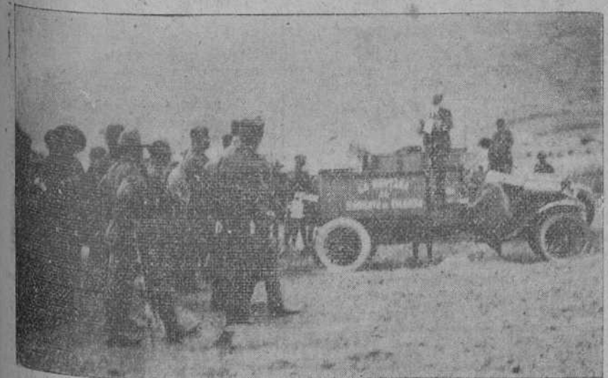
MELILLA.—Momento de hacerse entrega al batallón de Valencia de los autos-afibés regalados por la Montaña.