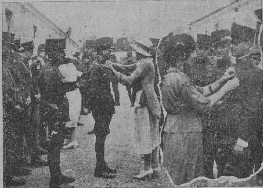
EN EL CUARTEL DE MARIA CRISTINA.—Señoritas colocando medallas y escapularios a los soldados de Valencia expedicionarios.

EL PUEBLO CANTABRO se halla a venta en los siguientes puntos. En Madrid: kiosco de «El Habate» calle de Atocha. En Bilbao: En la librería de Teófilo Cámara, Alameda de Manzanedo, y en el kiosco de la estación de Santander.