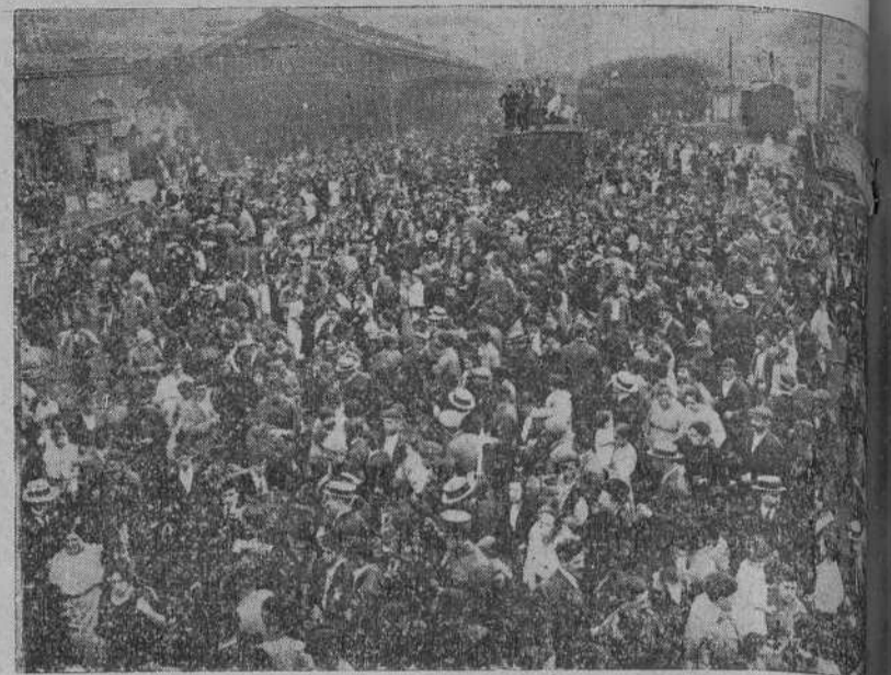
ASPECTO QUE OFRECIA LA ESTACION DEL NORTE EN LA MAÑANA DE AYER, CON OCASION DE LA SALIDA DE LAS TROVAS.

BARCELONA, 9.—Continúa el temporal de aguas. A causa de un desprendimiento de tierras que intercepta la vía no ha podido salir el tren correo de Valencia.