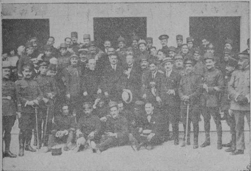
Grupo de suboficiales y sargentos con las autoridades, a la terminación del banquete con que fueron obsequiados en el Gran Hotel.