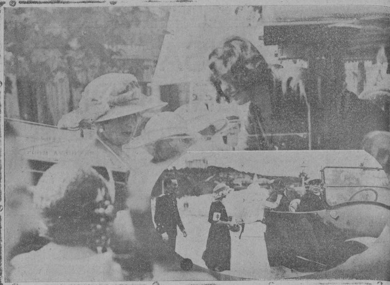
DE LA FIESTA DE LA FLOR.—El ocho de la Reina asaltado por las postulantitas. En el óvalo, el infante don Jaime entregando un donativo.