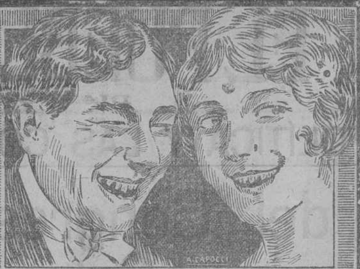
Estos usan a diario Dentífricos CALBER