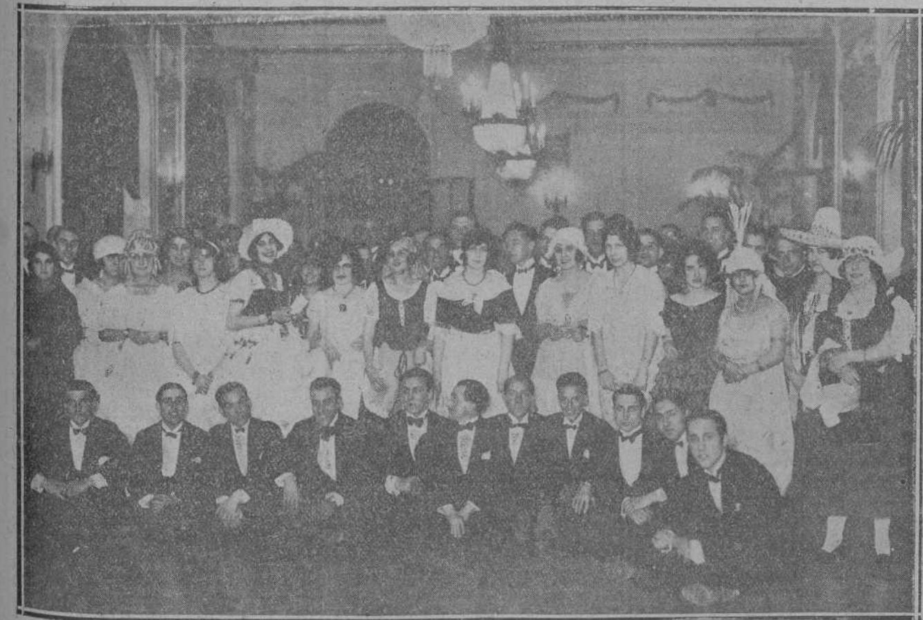
EN EL HOTEL REAL.—Una parte de los concurrentes al baile de la Prensa durante un descanso.