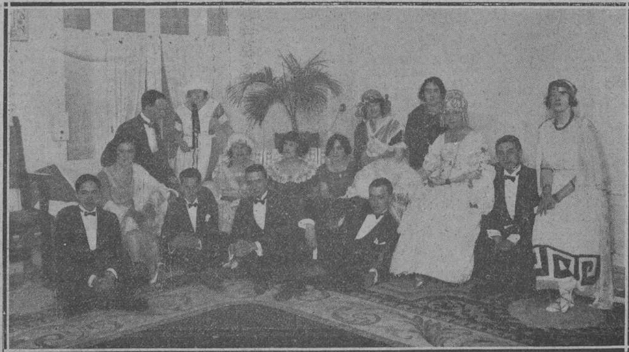
DEL BAILE DE LA PRENSA.—Grupo de bellas señoritas y distinguidos jóvenes concurrentes al Hotel Real.