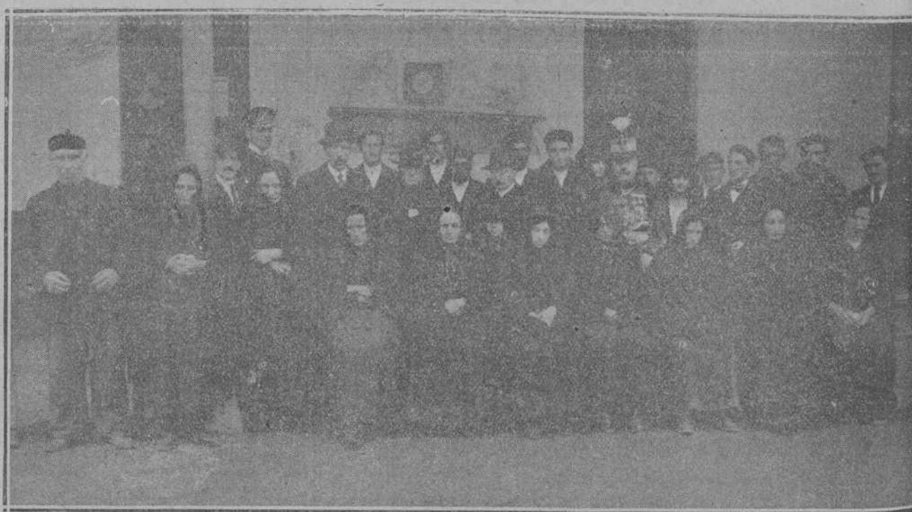
EL DOMINGO EN SANTOÑA.—Las familias de las víctimas del naufragio del «Maruca», con los asistentes al acto de la entrega de los donativos enviados por la colonia montañesa, en Cuba.

Próximo a finalizar el mes actual, rogamos a todos aquellos que no hayan abonado el importe de la suscripción lo hagan antes del día 31, pues de lo contrario dispondremos en giro a su cargo por la cantidad en que estén en descubierto hasta el 31 diciembre de 1920.