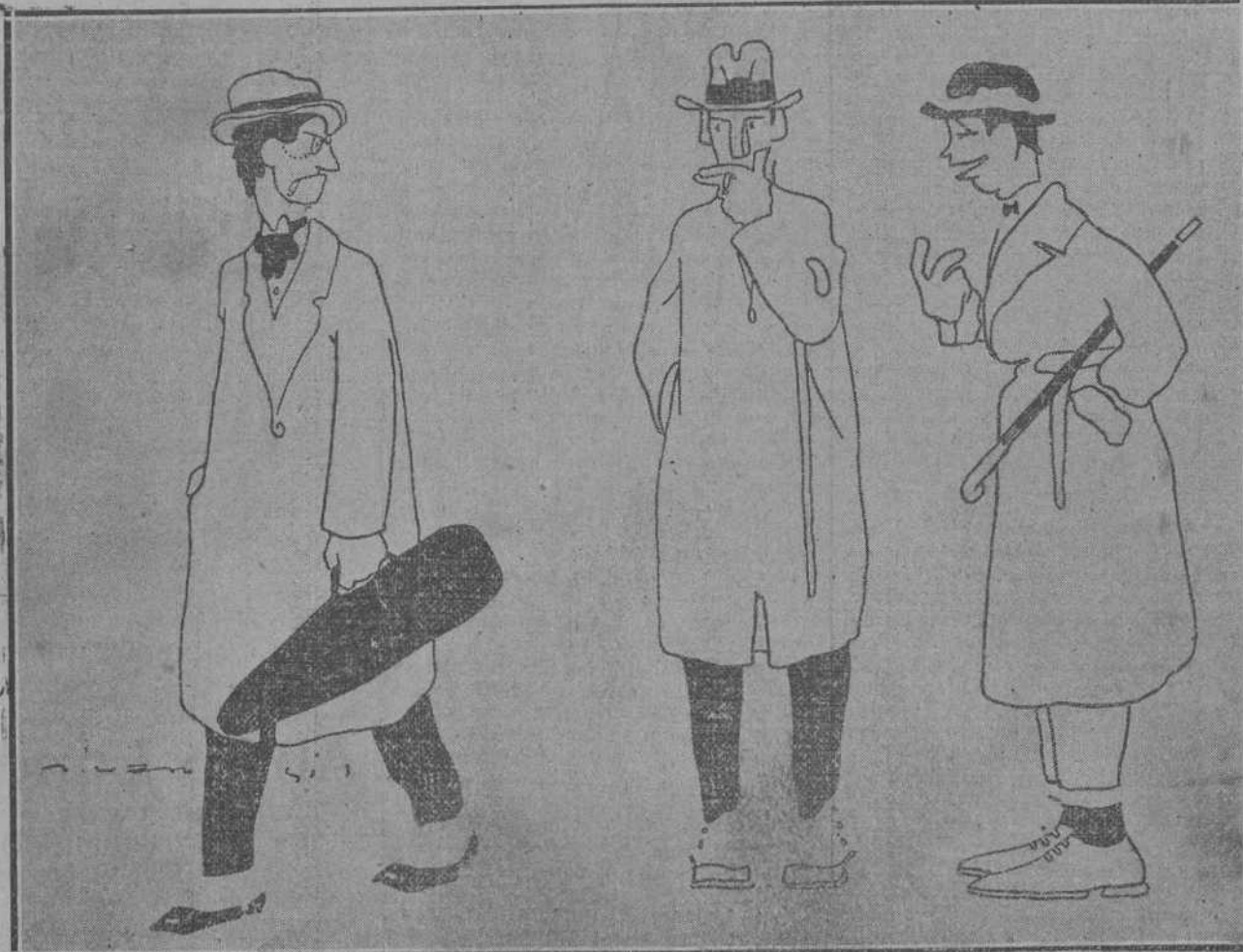
—Yo, en el lugar de los músicos, le declaraba ahora el «otocol» a la pianola.