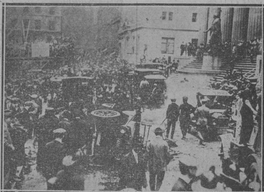
NUEVA YORK.—DE LA TERRIBLE EXPLOSION DE UNA BOMBA FRENTE AL BANCO MORGAN, EN WILL STREET—EL PUBLICO CONTEMPLANDO LOS DESTRUCCIONES CAUSADAS POR EL ARTEFACTO (Informaciónes gráficas Vidal-Madrid).