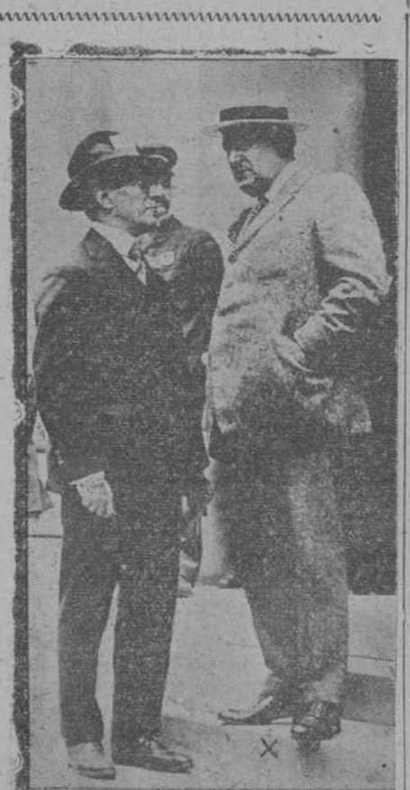
NUEVA YORK.—EL FAMOSO DETECTIVE MR. WILLIAM J. BURNS (X) A QUIEN SE HA EN CARGADO EL DESCUBRIMIENTO DE LOS AUTORES DEL ATENTADO CONTRA LA BANCA MORGAN, CONVERSANDO CON UN PERIODISTA.

Fue curado de una herida contusa, producida por bala, con orificio de entrada en la parte interior de la pierna izquierda y de salida en la parte exterior de la misma.