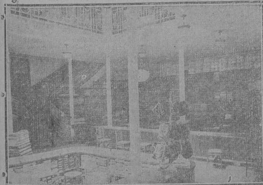
Vista general de la Sección de Lanería y Sedería (planta baja.)