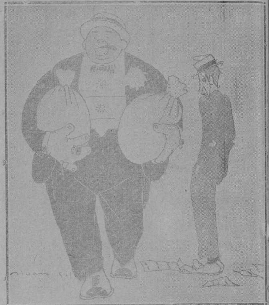
EL APRESIABLE Y SIMPATICO GORDO QUE AYER LLEGO A SANTANDER.