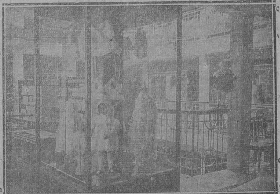
Un detalle de la Sección de confección de color y blanco (primer piso.)