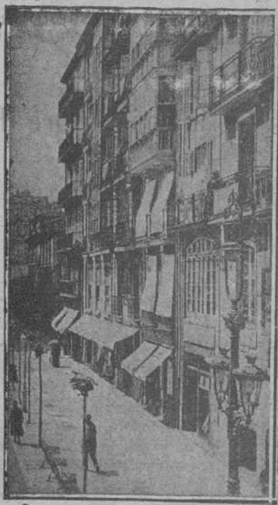
CALLE DE COLÓN

Colón, 14 (frente a la Pescadería) - Santander