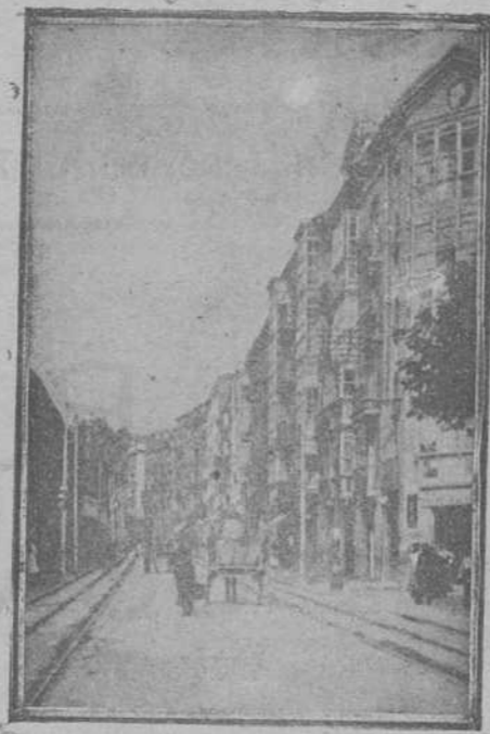
GALLE DE BECEDO