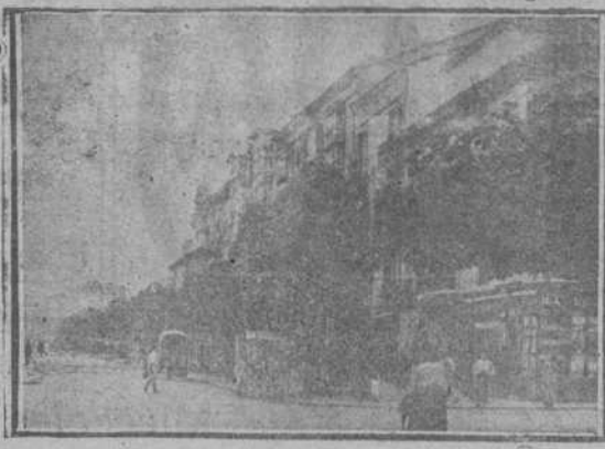
CALLE DE AMOS DE ESCALANTE