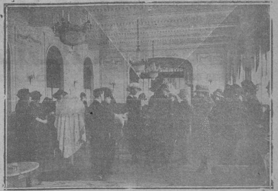
Su Majestad la Reina visitando la exposición de pieles de la CASA DUPONS, instalada en el Hotel Real.