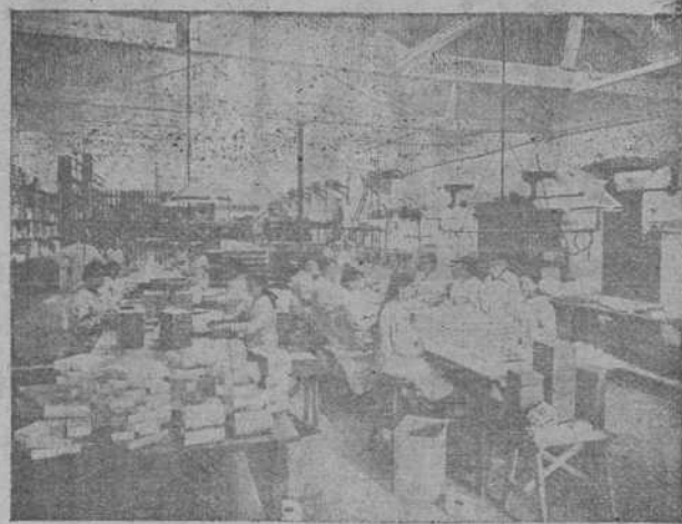
SALA DE ETIQUETADO Y EMPAQUETADO