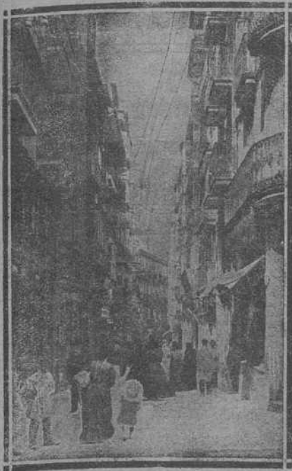
CALLE DE SAN FRANCISCO