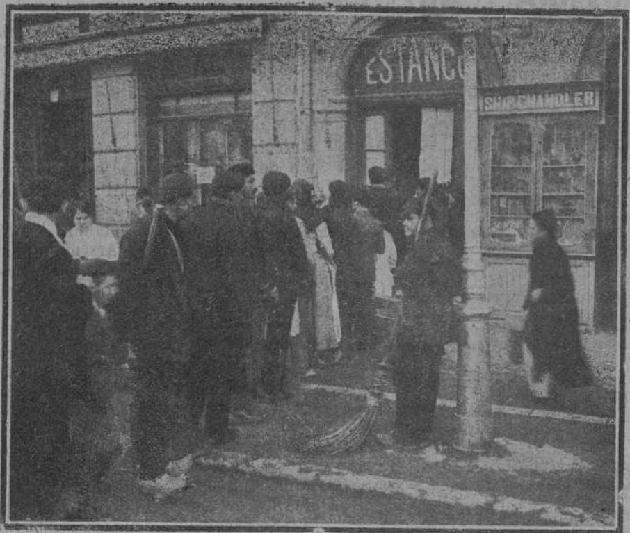
LA ESCASEZ DE TABACO.—Cola formada ayer, día de saca, ante un estancho de la Ribera.