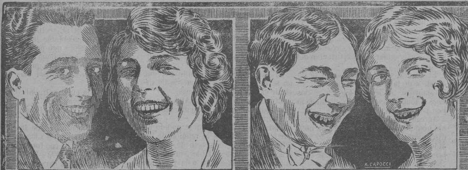
Estos usan a diario Dentifricos CALBER

MUEBLES USADOS. PAGA MAS QUE HABIE. JUAN DE HERRERA, 2.