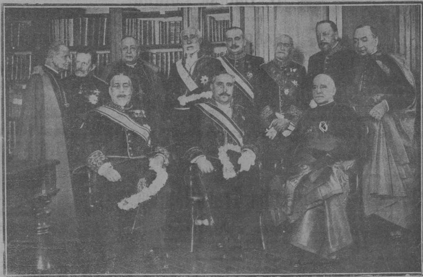
EL NUEVO ACADÉMICO DE LA LENGUA, RODEADO DE LAS ILUSTRES PERSONALIDADES QUE PRESIDIERON EL ACTO. SENTADOS, DE IZQUIERDA A DERECHA: PRESIDENTE DEL CONSEJO DE MINISTROS, CONDE DE LA MORTERA Y CARDENAL GUISASOLA. DE PIE, DE IZQUIERDA A DERECHA: OBISPO DE SION, GENERAL WEYLER, OBISPO DE SAN LUIS DE POTOSI, DON ANTONIO MAURA, MINISTRO DE INSTRUCCIÓN PÚBLICA, VIZCONDE DE MATAMALA, MINISTRO DE LA GOBERNACIÓN Y OBISPO DE MADRID ALCALÁ.