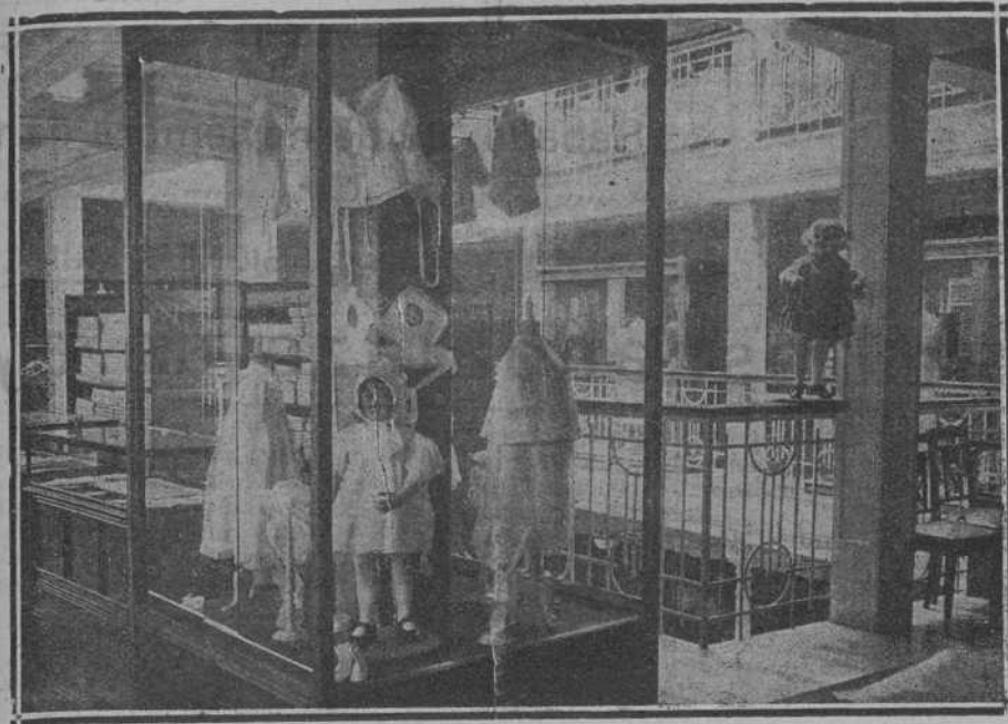
Vista general de la Sección de Lanería y Sedería (planta baja.)