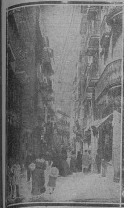
CALLE DE SAN FRANCISCO