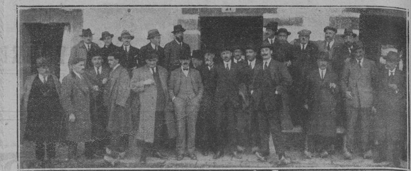
DE TRECEÑO.—LAS AUTORIDADES, EL PRESIDENTE DE LA ASOCIACIÓN DE GANADEROS, JURADO Y ALGUNOS EXPOSITORES AL TERNAR EL BANQUETE VERIFICADO DESPUÉS DE REPARTIR LOS PREMIOS GANADOS PRESENTADO AL CONCURSO.