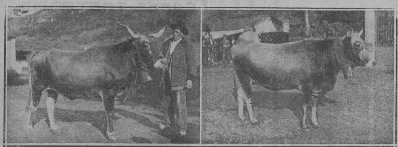
DE TRECEÑO.—DOS PRECIOSOS EJEMPLARES DE VACAS QUE OBTUVIERON PRIMEROS PREMIOS EN EL CONCURSO DE GANADO TUDANO

Consulta todos los días, de once y media a una, excepto los festivos. BURGOS, NUMERO 1, SEGUNDO