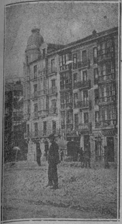
CALLE DE MENDEZ NUÑEZ