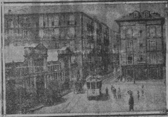
CALLE DE ATARAZANAS