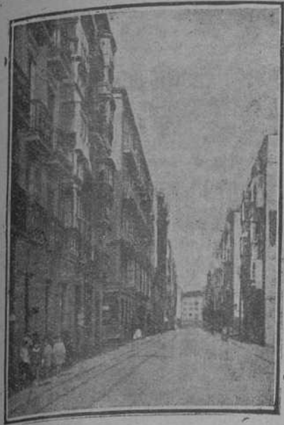
Calle de Velasco y General Espartero.