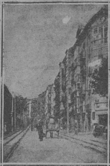
CALLE DE BURGOS