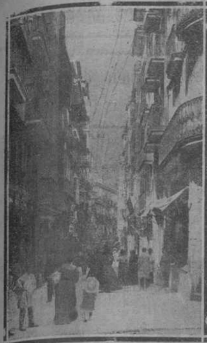
CALLE DE SAN FRANCISCO

Este solo epigrafe es la mejor garantía de cuanto nosotros pudiéramos decir en favor de tan acreditada Casa.