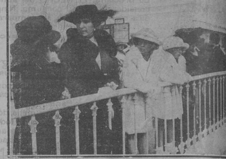
DE LAS CARRERAS DE AYER.—Su Majestad el Rey pasando por el establo.—Su Majestad la Reina y sus Altezas las infantas doña Cristina y doña Beatriz presenciando la subasta de un caballo.

Yo me imagino a la Sociedad... El trabajo empleando parte de un capital social en adquirir terrenos para construir la casa tipo para el obrero, me parece un proyecto muy interesante, pero que no debe tenerse en cuenta sin antes haberse estudiado muy a fondo la situación de la población, y veo a la familia del obrero pagando el mínimo de alquiler posible, para llegar más tarde a convertirse en la propietaria de la casa, si bien con la única restricción, favorable para todos, y es que no es de una propiedad definitiva, pero sí usufructuaria por vida.