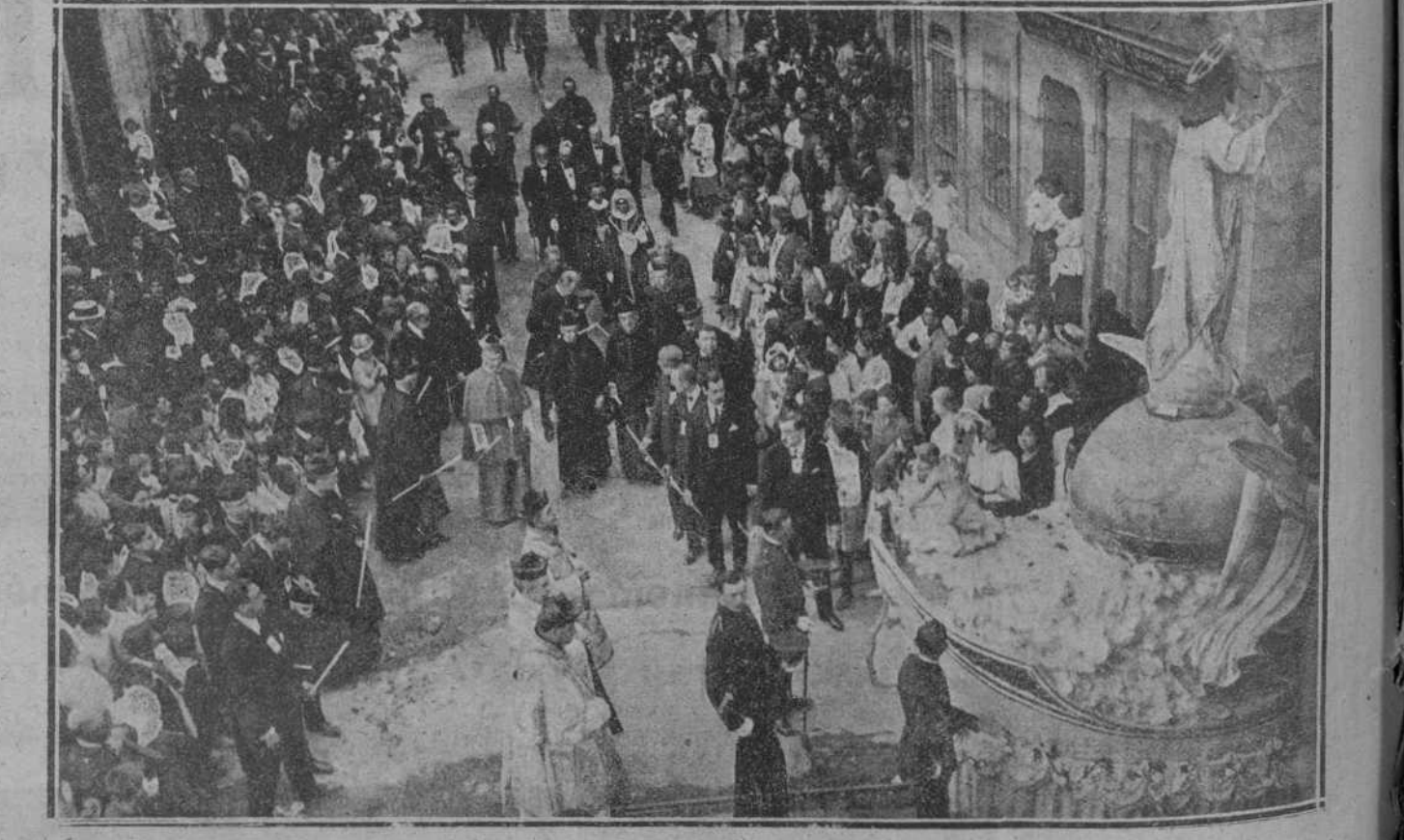
Las autoridades que presidieron la p procesión del Sagrado Corazón de Jesús.