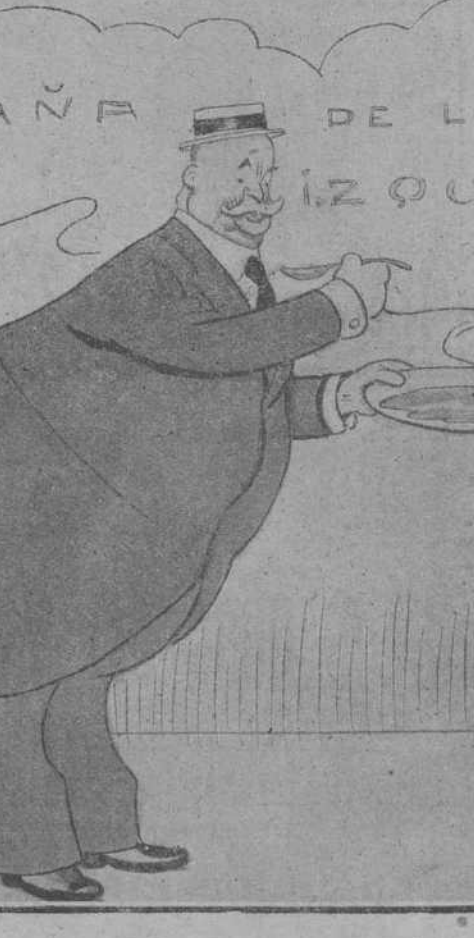
—Es de admirar el estómago de que disfrutan los ciudadanos que se tragan esto a diario.

UN GUISO REPUGNANTE. Campaña de las izquierdas.