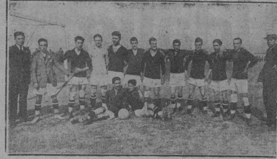
El equipo del «España F. C.», de Barcelona, que hoy juega el tercer partido con el «Racing», en los Campos de Sport.