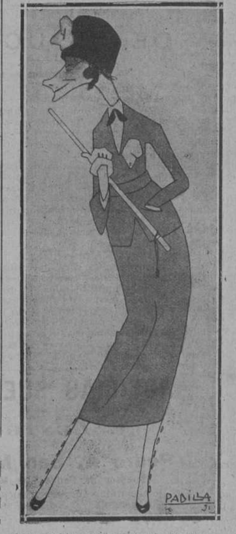
La notable cancionista Emilia Bracamonte, que ha actuado con éxito en el Gran Casino. (Caricatura, por Padilla.)

FOTÓGRAFO. PALACIO DEL CLUB DE REGATAS.—SANTANDER. PRIMERA CASA EN AMPLIACIONES Y POSTALES