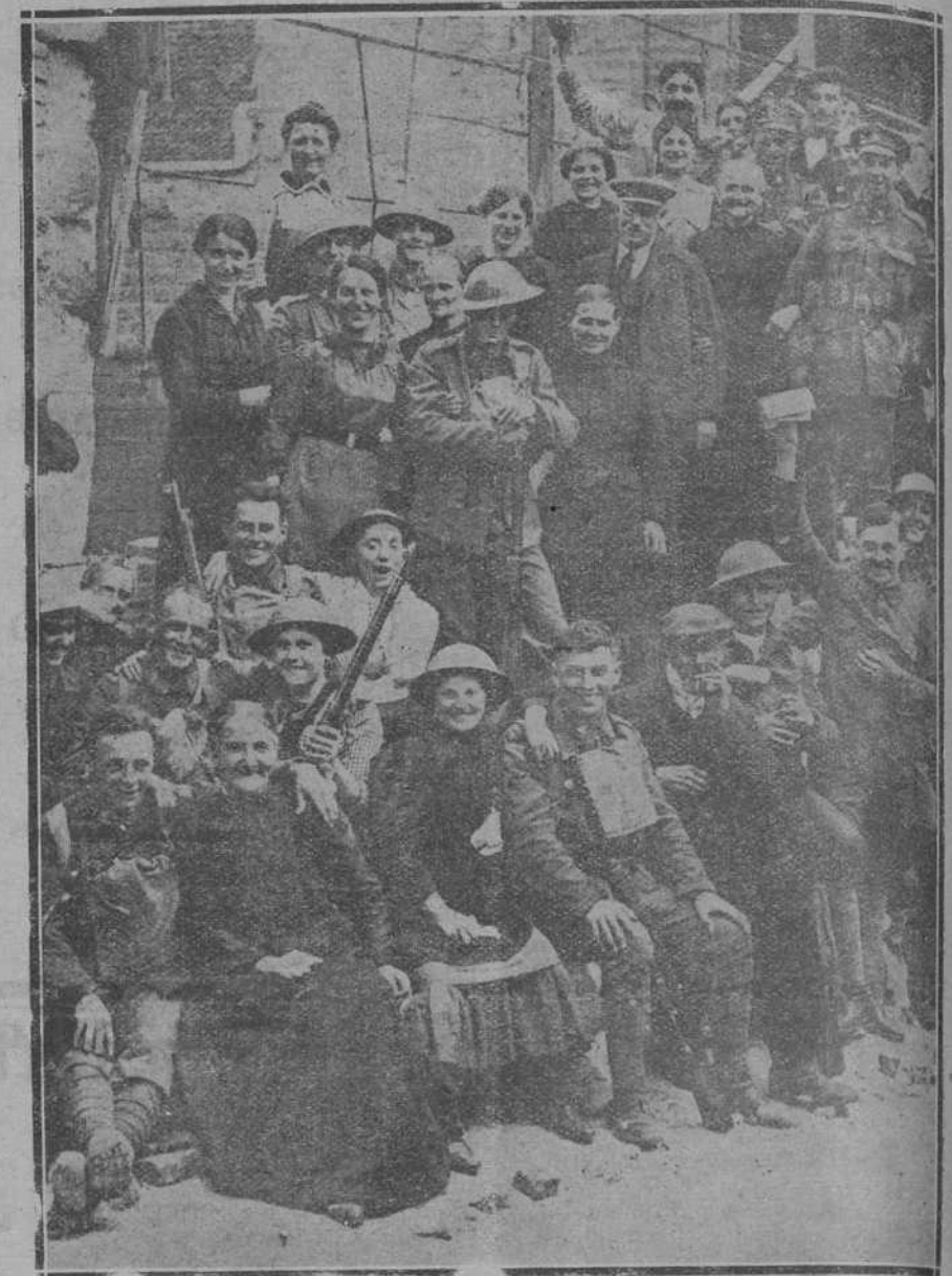
Habitantes de la villa de Sandemont, situada a 20 kilómetros de Arras, fraternizando con las tropas aliadas al recuperar éstas dicha villa.

de los señores diputados firmantes de la proposición ni de la Diputación en pleno, pues rasgos como el descrito, son por sí mismo alabados. Pero si deseo decir que la excelentísima Diputación provincial de Santander ha sido la primera que en España ha llevado a la práctica tan plausible idea, admirablemente recibida por el elemento obrero.