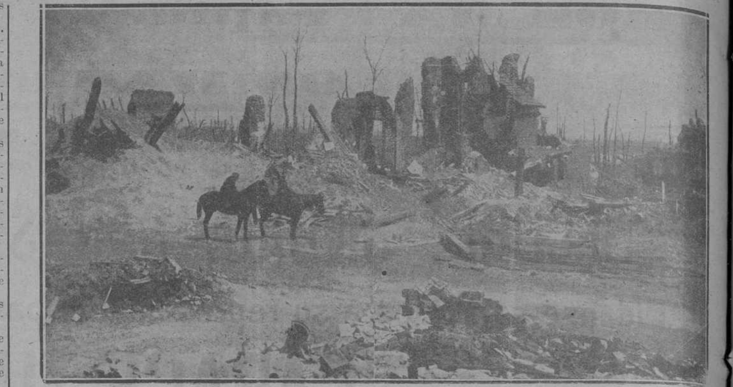
LOS DESTROZOS DE LA GUERRA.—Soldados australianos descansando ante las ruinas de una iglesia, en la calle principal de la ciudad de Fiers.