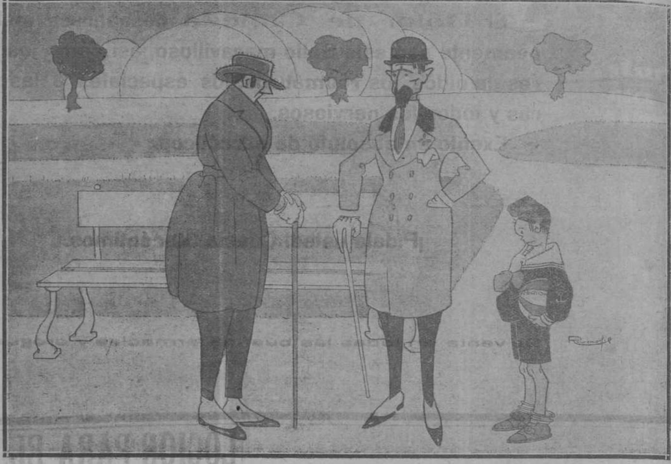
GAMBO. Ahora es preciso esperar a que se firme un Gobierno definitivo. Si, por vamos a sentarnos, no sea que se canse el niño.