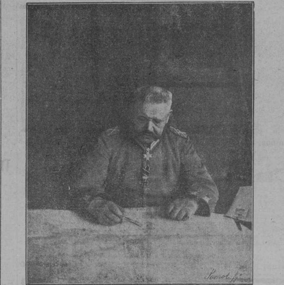
El mariscal Hindenburg, que ha dirigido una interesante proclama a los ejércitos alemanes.

LONDRES.—Comentando el «Morning Post» la formación del nuevo Gobierno socialista alemán, recuerda que en el momento de estallar la guerra declararon los socialistas de Alemania que antes que nada eran alemanes.