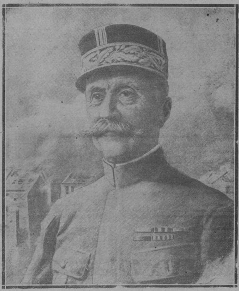
El mariscal Foch, generalísimo de las tropas aliadas, que dirigió a los comandantes generales la orden de suspender el fuego en todos los frentes.

En el cuerpo de la abogada mujer, y a enfermedad florido fundamentalmente en su carne. Aún pretendia seguir prestando sus valiosos servicios; pero los médicos la obligaron a volver a su residencia, donde entregó su alma al Criador, a los treinta y un años de edad. Su muerte fue dulce y apacible, como la de una santa. El Señor haya acogido su alma en la mansión de los justos.