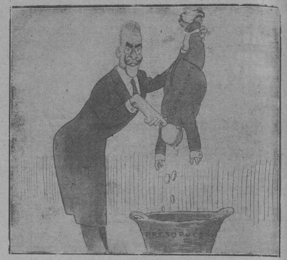
BESADA. —No sé de qué se extrañan los cuñadillos revolucionarios, si siempre he peñado yo mismo: mientras uno chupara otros escupiera.

Nada dicen ellos ni la más mínima queja ha salido de sus labios por su enorme y santa labor, llevada a término incansablemente un día y otro, de día y de noche, satisfechos de cumplir su sagrado ministerio, aunque en cada casa les aceche el contagio del mal y con él, posiblemente, a muerte. Pero queremos nosotros atenuar, en parte, su cansancio y para ello pensamos en la gran obra de caridad que llevarían a cabo nuestros concejales dueños de automóviles, poniendo a disposición de las respectivas parroquias sus vehículos, para llevar en ellos a los sacerdotes portadores de la Hostia sacrosanta. Creemos muy fundadamente, dada la caridad cristiana de los santanderinos, que no caerá en el vacío nuestro ruego, y que las parroquias contarán seguidamente con ayuda tan beneficiosa y tan práctica.