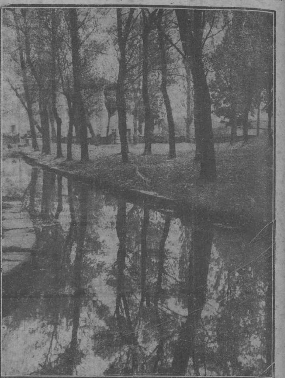
PAISAJES MONTAÑESES.—Reinicia: «Las Fuentes».