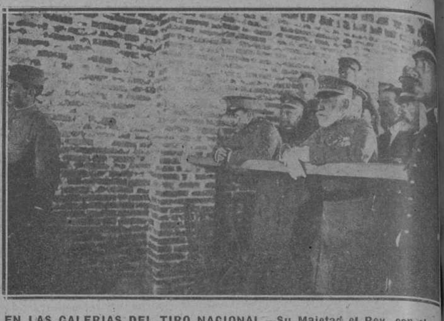
EN LAS GALERIAS DEL TIRO NACIONAL.—Su Majestad el Rey, con el general Luque, presenciando la tirada de velocidad.