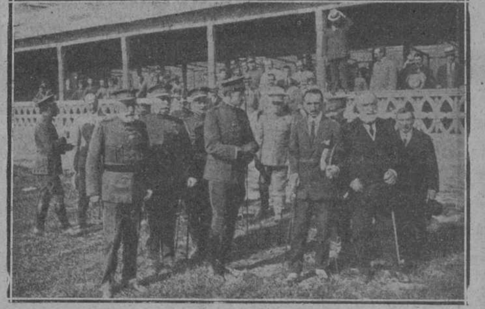
EN EL POLIGONO DE LA ALBERCIA.—Su Majestad el Rey, al salir del campo de tiro, despidiéndose de las autoridades.