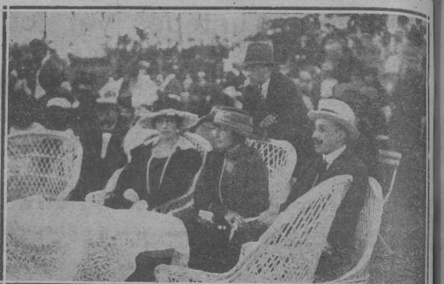
EL TENNIS.—Sus Majestades los Reyes con la infanta doña Luisa y el infante don Alfonso, presenciando la fiesta de ayer.

Con la fecha del día de Santiago, patron de España, y dedicada a la gloriosa efeméride del 1.º de agosto de 718 de la batalla de Pelayo, publicó el virtuoso monarca don Alfonso IX, el virtuoso monarca don Alfonso IX, el virtuoso monarca don Alfonso IX.