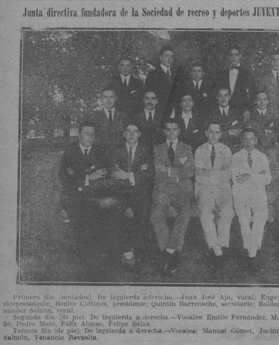
Junta directiva fundadora de la Sociedad de recreo y deportes JUVENTUD MONTAÑESA, de la Habana.

Hemos entrado en la época del sombrero de paja y del cronista veraniego, cosas ambas que allá se van en cuanto a necesidad pública. Dentro de pocos días, en cuanto la temperatura haga un llamamiento verdad al sudor colectivo, veremos aparecer en las columnas de los periódicos de Madrid y de otras poblaciones que no tienen mar «por abandono de su Ayuntamiento» ahora se lleva mucho eso de culpar a los Ayuntamientos de todo lo que pasa—elegantes y que frivolas crónicas veraniegas, hablando de todo menos de lo que puede interesar a la gente. Nosotros lo venimos observando. El director de un periódico de Madrid llama a