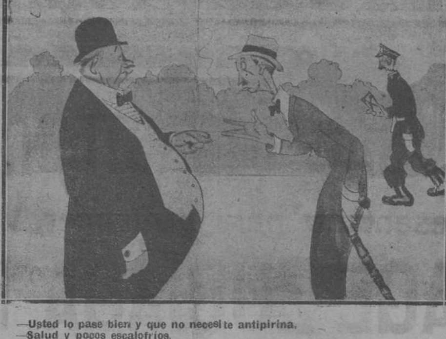
-Usted lo pase bien y que no necesite antipirina. Salud y pocos escalofríos.