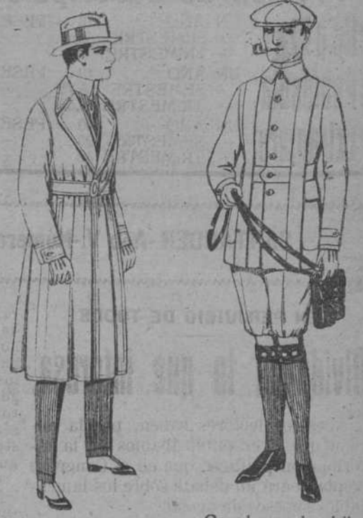
Gabanes de gabardina impermeabilizada, diferentes colores. de ptas. 43 a 115.