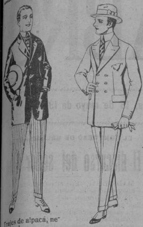
Trajes de alpaca, ne... de ptas. 35 a 60. Pantalones de dril ó blanca o lis... de ptas. 6,50 a 30.

PRECIO FIJO :: VENTAS AL CONTADO PÍDASE EL CATALOGO GENERAL