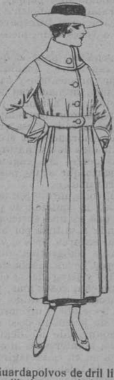
Guardapolvos de dril li... so y dibujos novedad. de ptas. 22 a 28. Los mismos, de alpaca gris. a ptas. 45.