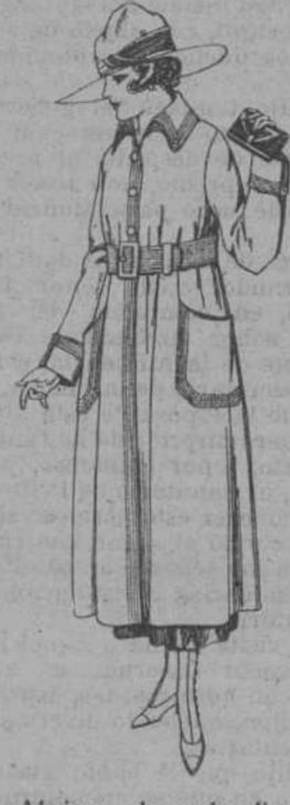
Abrigos de gabardina inglesa, impermeabiliza... dos, en color beige, bor... dados. de ptas. 80 a 95.