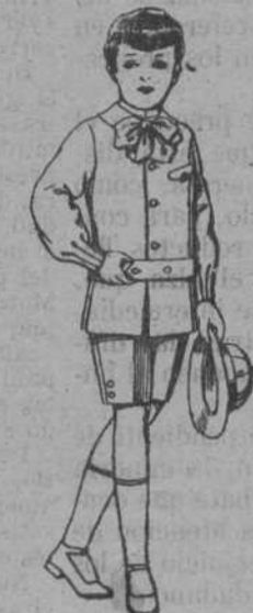
Trajes de lanilla, etc., para ni... ños de 4 a 9 años. de ptas. 10 a 18.