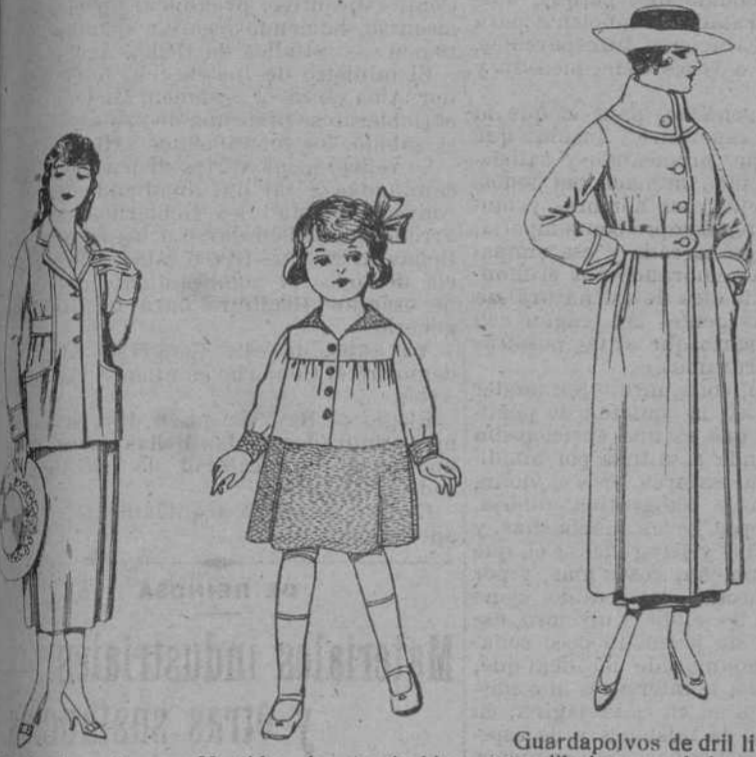
Trajes de estam... gabardina, et... en azul y co... de ptas. 48 a 58.