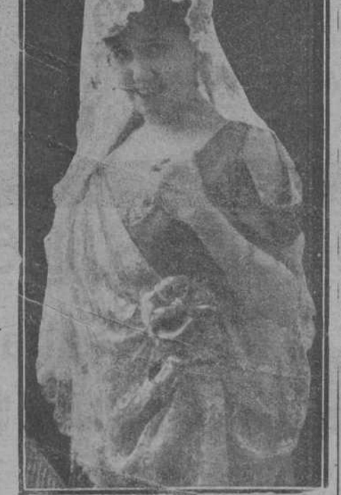
era necesario a aquella vida lujosa y elegante que había de ser al fin comida de las fieras.