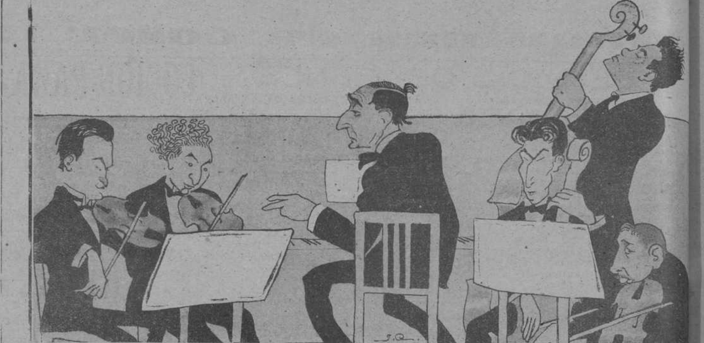
LA ORQUESTA DEL CASINO DEL SARDINERO

«La «Epoca» desmiente la noticia de que los conservadores estuvieran dispuestos a no asistir al banquete oficial de Palacio.