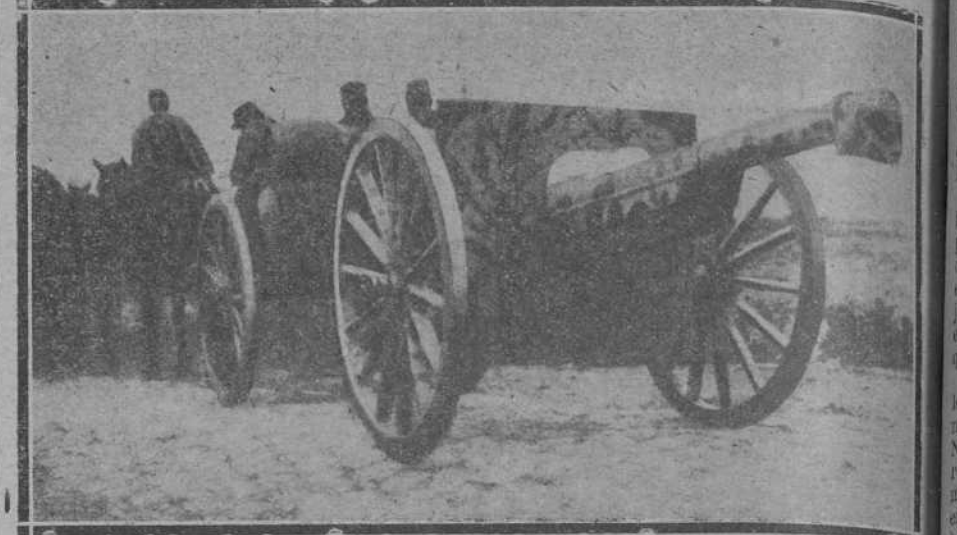
DE LA GUERRA EUROPEA.—Un cañón alemán, camuflado por medio de dibujos de árboles.