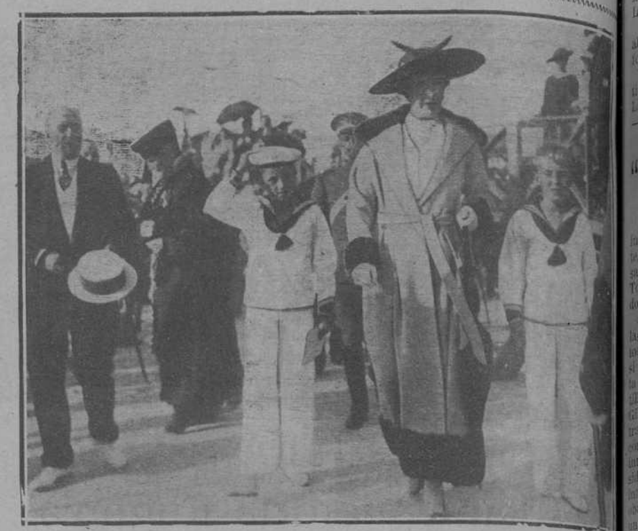
DEL CONCURSO HIPICO.—Su Majestad la Reina, el príncipe de Asturias y el infante don Jaime al salir del campo.

Complimentando. MADRID, 29.—Está arduo el cumplimentando al Rey el duque de Bivona. El duque de Almodóvar.