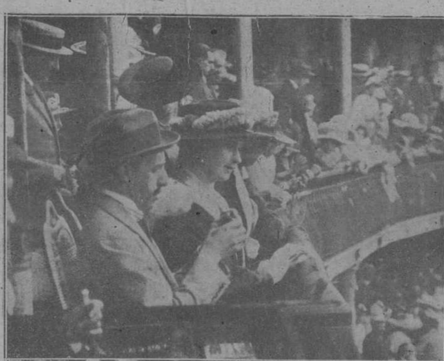
El palco regio durante la corrida.

—Y cuándo será la segunda reunión?— insistimos.—¿Dónde? ¿Será en Cataluña?