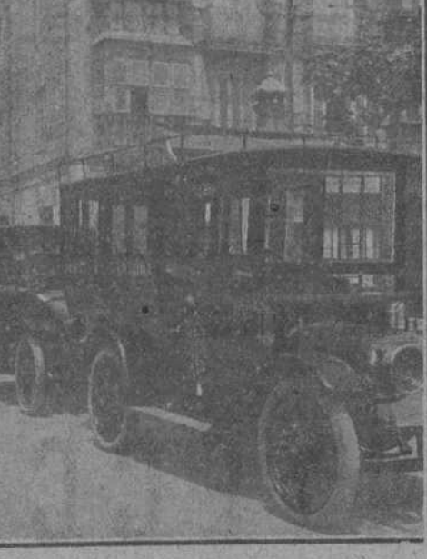
Coches omnibus, particular y furgón de La Trasmirana.

Añotado: dime con franqueza que equipo de cuantos han desfilado por el campo del "Racing" te ha gustado más por su juego limpio y elegante. La "Real Unión", de Irún, ¿no es verdad? Pues