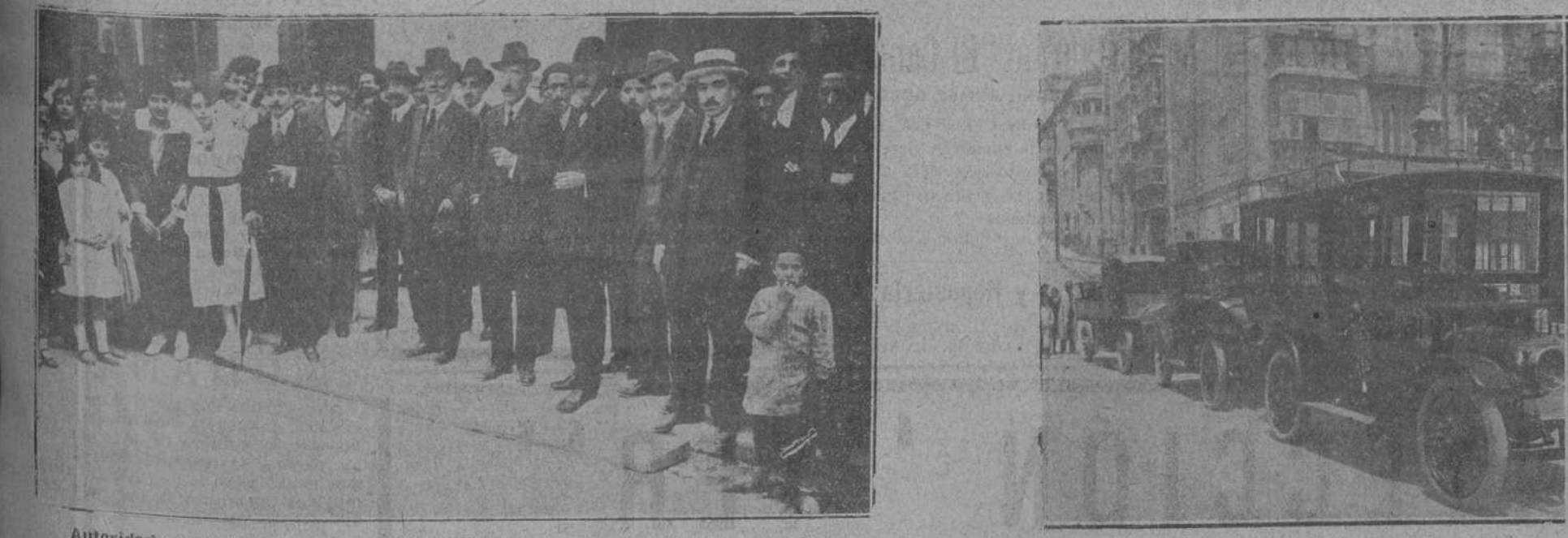
Autoridades y distinguido público de Santona, en el momento de la inauguración.

De Gama a Santona. Billetes para un solo viaje. De Santona a Berriá, 0,20; a Arguños, 0,50; a Escalante, 0,75; a Gama, 0,85. De Berriá a Arguños, 0,30; a Escalante, 0,65; a Gama, 0,75. De Arguños a Escalante, 0,40; a Gama, 0,50. De Escalante a Gama, 0,25. El coche furgón dispuesto para mercancías es magnífico, con potente motor y una velocidad relativa, y funciona bajo la siguiente tarifa: Por cada bulto de 0 a 15 kilos, 0,25 pesetas, por todo el recorrido; de 16 a 30 kilos, 0,50; de 31 a 50 kilos, 1,00; por fracción de 10 kilos que exceda de los 50; 0,20. Mercancías de gran velocidad. Por expedición de 0 a 20 kilos, 0,25 pesetas, por todo el recorrido; por expedición de 21 a 50 kilos, 0,50; por fracción de 10 kilos que exceda de los 50; 0,10; por cada paquete postal, 0,25. Mercancías en pequeña velocidad. Mercancías de todas clases, excepto las designadas a continuación, por 1.000 kilos, 5,00 pesetas; Cartones (excepto tabaco), hierro, maderas, ladrillos, cementos, yeso y demás materiales de construcción, harinas y cereales, por 1.000 kilos, 4,50 pesetas; cristalería, mármol, loza, fina, muebles, maquinaria y envases que vacíos conserven el mismo volumen que llenos, por 1.000 kilos, 10,00 pesetas; minimum por expedición, 0,25. A los precios fijados en la presente tarifa se agregarán los que sean aplicables en los ferrocarriles de Santander a Bilbao para las expediciones combinadas con dicha Compañía. El transporte de mercancías en Gama es gratuito.