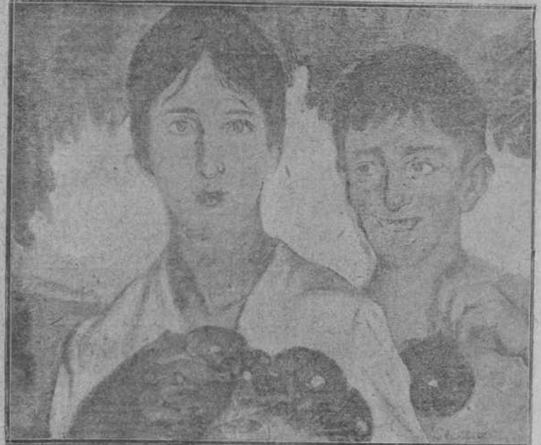
Vidas que nacen.

«Vidas que nacen»—cubriendo el lienzo con un cristal, resulta este cuadro gratísimo más que ningún otro. Y eso que el retrato de la madre del artista es otro acierto que hace pensar un momento en el autor célebre de Whistler.