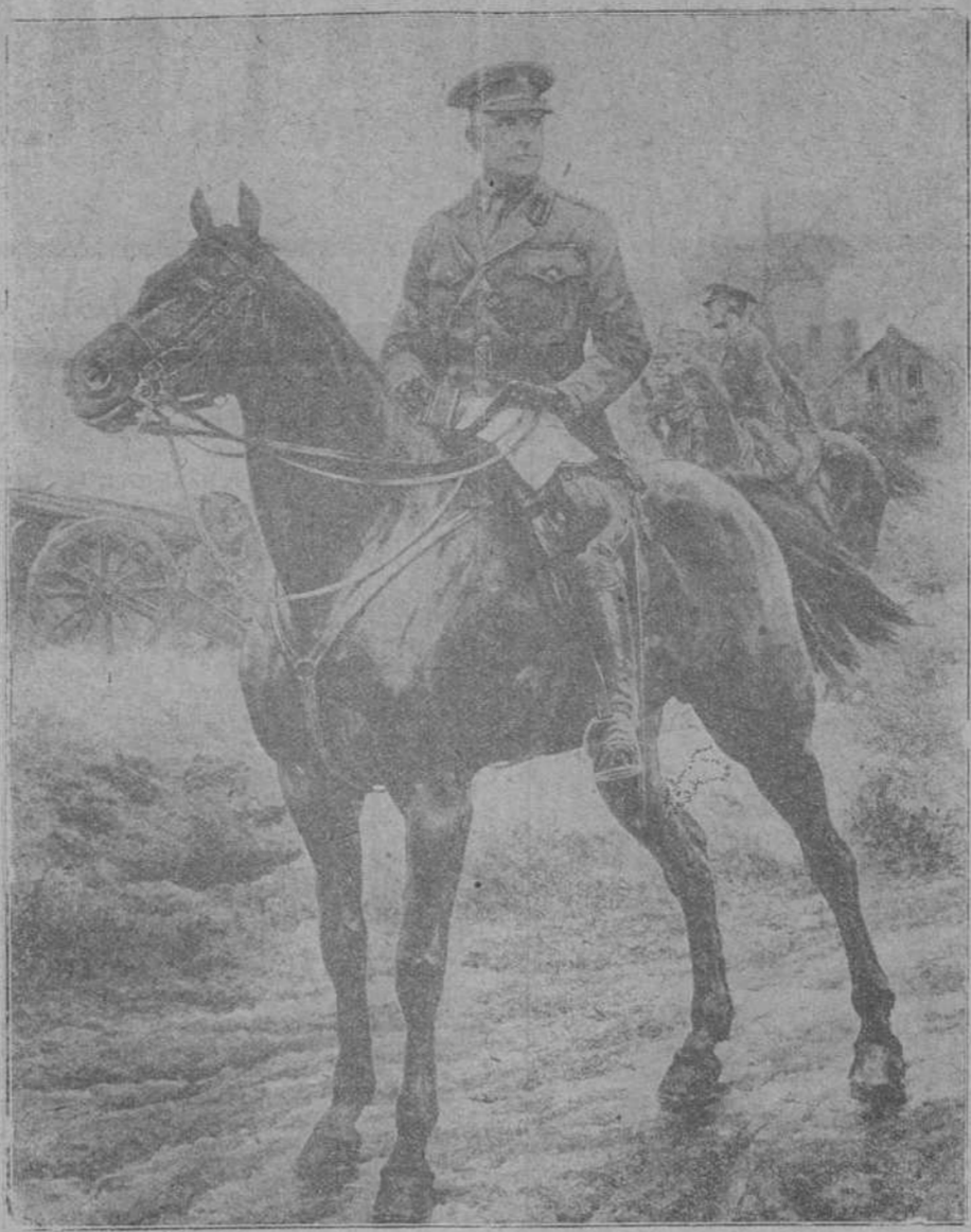
DE LA GUERRA.—El general Mr. Sam, nuevo ministro de la Guerra de Canadá.