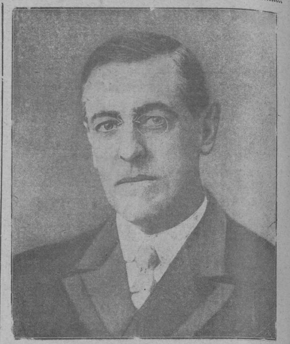
Mister Wilson, actual presidente de la República de los Estados Unidos, y que, según las últimas noticias, tiene casi segura la reelección

Al final, los ciegos todos unieron sus aplausos unánimes en una ovación, que fué recibida desde el escenario por otro ciego insigne: Galdós.