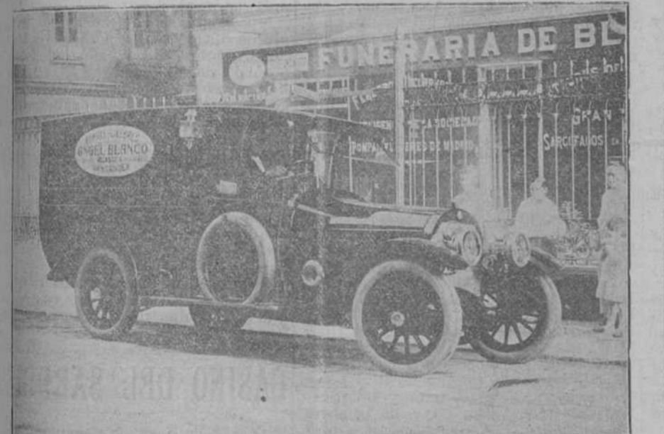
Furgón automóvil para conducción de ferretos dentro y fuera de la población.

Esta Agencia acreditada se hace cargo de todos los asuntos pertenecientes a este ramo, para dentro y fuera de la capital. Gran surtido en arcos, sarcófagos, coronas, etc., así como el servicio más modesto. Surtido en coronas, sarcófagos, etc. Cama imperial o capilla ardiente. Se reciben encargos por telégrafo. TELÉFONO NUMERO 117