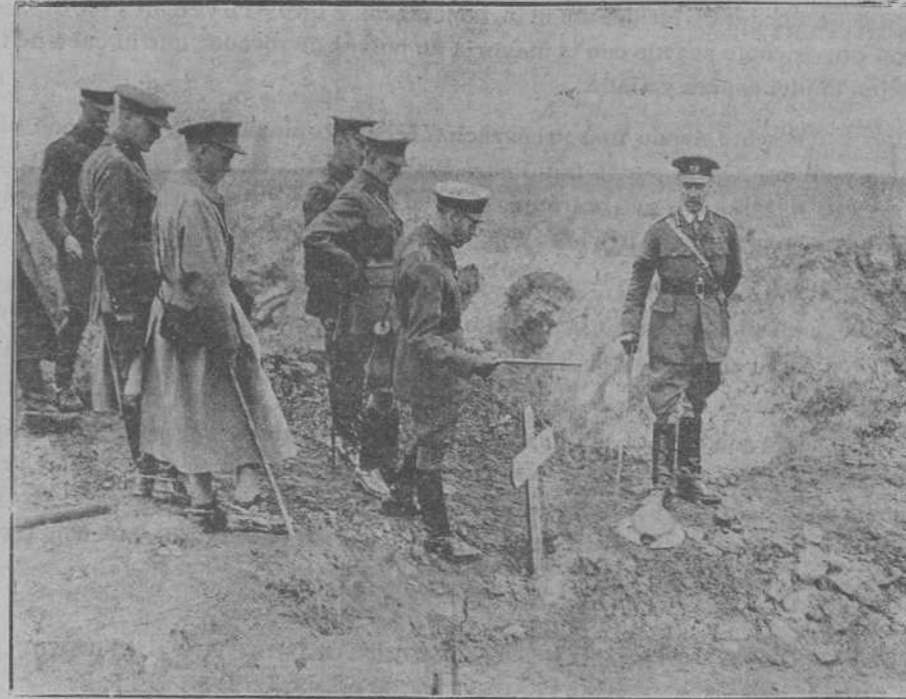
DE LA GUERRA EUROPEA.—El Rey de Inglaterra y el príncipe de Gales en su visita al frente francés, ante la tumba de un soldado.

tos, de pecho, de rodillas; todos muy cerca y valiente.